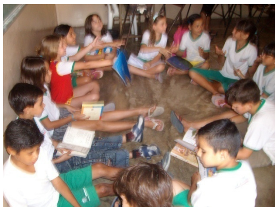
Imagem 3 – Alunos no momento do debate do Livro que eles escolheram.

Tem casos de crianças, que eu acho muito interessante, que enquanto a promotora está contando a estória, ela fica se imaginando dentro do livro, ela se imagina um personagem da estória, um caso muito que me chamou a atenção, foi no sitio da Pedra Branca, quando uma criança me chamou e disse: “tia, eu quando eu chego em casa, que vou me deitar, antes de fechar os olhos, eu fico lembrando da estória, ai parece que eu saio dentro de mim e entro naquele livro que a senhora contou”, isso no meu olhar é como ela tivesse uma nova identidade, ela começa a construir uma nova percepção de mundo.