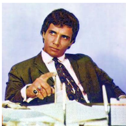
Realidade (maio de 66)