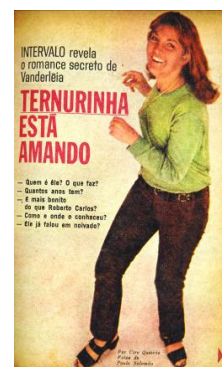
Intervalo (Maio/Junho de 1966)

presente nas páginas de Intervalo : “Erasmus é lenha no ié. ié, ié.”; 14 “Erasmus denuncia panelinha da Bossa Nova”. 15