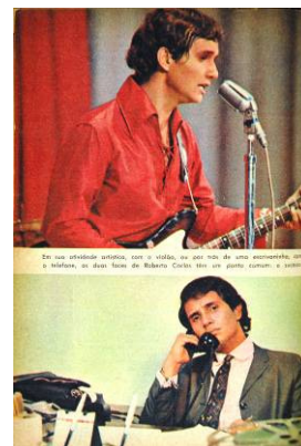
Intervalo (maio de 66)