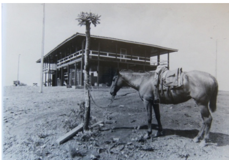
Foto 06 Palacinho: Primeiro edifício da Capital e Primeira Sede do Governo. Autor: Elson Caldas (1989). Fonte: Casa da Cultura (2009).

Chama atenção, também, em Palmas a primeira residência do Governador, o ‘Palacinho’ (Foto 06), que possui muitas semelhanças, a começar pelo nome, ao ‘Catetinho’ (Foto 07), primeira residência do Presidente da República em Brasília.