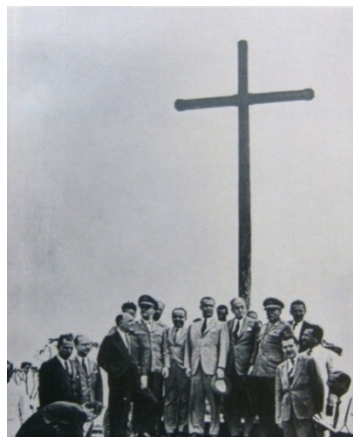
Foto 04: Primeira Missa de Brasília (1960)