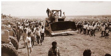
Foto 01: Siqueira Campos dirigindo um trator na Inauguração de Palmas (1989).

As ‘lembranças’ e ‘inspirações’ à Brasília se estendem às associações de Siqueira Campos a Kubistchek, muitas vezes em emblemáticas situações, como em fotos oficiais muito similares. Uma é bastante marcante e mostra Juscelino sobre um trator, simbolizando a construção da nova cidade. Siqueira Campos aparece em cenário semelhante na inauguração de Palmas (Fotos 01 e 02). Outros registros semelhantes são feitos quando empresários e autoridades estrangeiras visitam o canteiro de obras dessas cidades. Há diversos registros, também, junto aos operários.