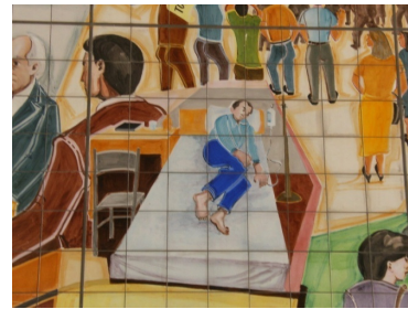
Foto 05: Deputado Siqueira Campos greve de fome para aprovar o projeto de criação do Tocantins (Painel de Dj Oliveira, 2002).