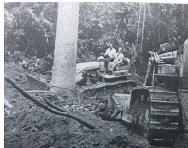
Foto 02: Juscelino Kubistchek de co-piloto em um trator que participava da derrubada da mata original. (1957)