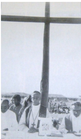
Foto 03: Primeira Missa em Palmas (1989)

O que entende-se a respeito destas práticas é um evidente anacronismo, pois a Primeira Missa no Brasil nada tem a ver com a inauguração dessas cidades novas, a não ser por tornar-se um poderoso signo que será utilizado como parte da história daquele lugar, tornando-se também um ‘lugar de memória’, que perpetuará a intenção do seu fundador, visto que o Cruzeiro muitas vezes é preservado como monumento oficial da cidade. Tais práticas se sustentam em ações passadas, de onde se extraem símbolos capazes de legitimar as ações do presente, como se ali estivessem desbravando novas terras e tomando posse do lugar. As imagens falam por si.