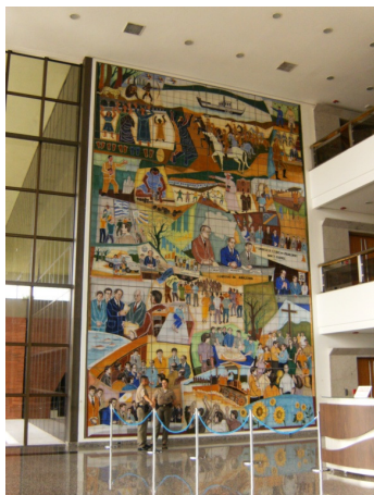
Foto 03: Paineis 2 - História do Tocantins, Período Republicano (2002). Autoria: Patrícia Orfila (2009).

vez fortalece o vínculo entre arquitetura e o discurso político hegemônico de seus criadores, aqui aparece no cenário político mais um personagem “convocado” a ilustrar a história tocantinense: o artista plástico DJ Oliveira. O Palácio Araguaia é um exemplo claro dessa intenção, onde dois grandes painéis foram fixados nas paredes do hall de entrada, obra do artista supracitado (Fotos 03).