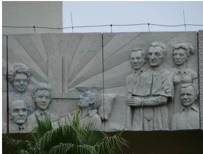
Foto 04: Deputado Siqueira Campos em emblemática greve de fome para aprovar o projeto de criação do Tocantins (Painel de Maurício Bentes, 2002).

Siqueira Campos lançou mão deste recurso utilizando os artistas pra tais fins. DJ Oliveira e Maurício Bentes produziram símbolos para o novo lugar. Basta analisar as imagens que seguem (Fotos 04 e 05).