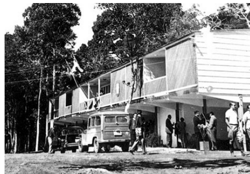
Foto 07: Catetinho: a primeira repartição pública e uma das construções pioneiras de Brasília, onde Juscelino se hospedava e despachava em suas visitas à região (1956).

O Palacinho abrigou inicialmente as autoridades durante as visitas às obras de construção da cidade, mas, com a antecipação da transferência da capital provisória de Miracema do Norte para o local permanente, foi necessário adaptá-lo para funcionar como sede administrativa do novo Governo.